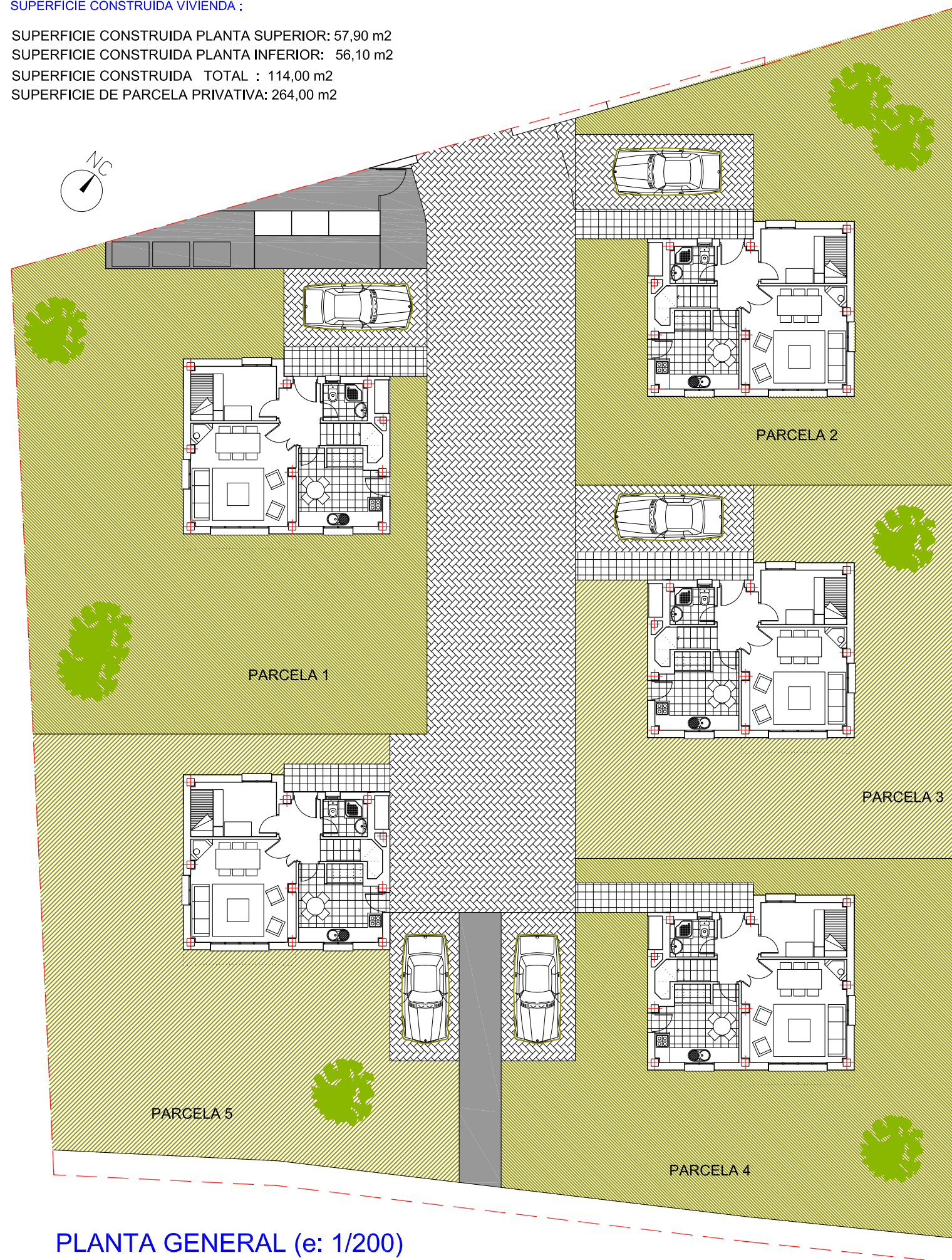
PLANTA GENERAL (e: 1/200)

SUPERFICIE CONSTRUIDA PLANTA SUPERIOR: 57,90 m 2 SUPERFICIE CONSTRUIDA PLANTA INFERIOR: 56,10 m 2 SUPERFICIE CONSTRUIDA TOTAL : 114,00 m 2 SUPERFICIE DE PARCELA PRIVATIVA: 264,00 m 2